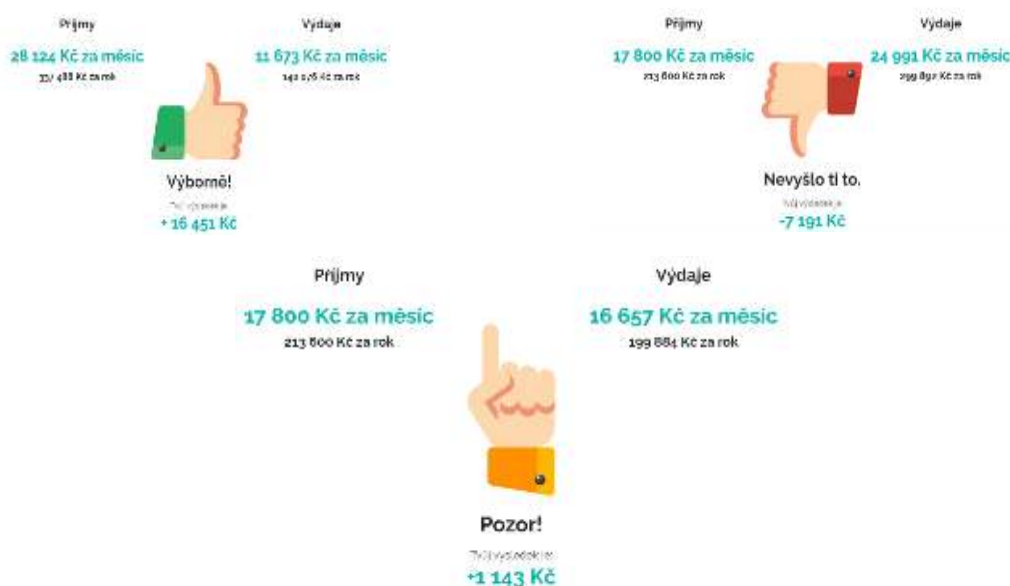
Obr. č. 2. 6: Ukázky výsledky hospodaření

Tato nepovinná část je zaměřená na plánování života krátce po ukončení školy a vstupu po vstupu na trh práce. Žák se zde seznámí se základními životními náklady a postupně volí v kategoriích bydlení, jídlo, doprava, ostatní a finanční rezerva. V sekci bydlení je nutné zvolit typ bydlení a formu vlastnictví. Kromě bydlení s rodiči mají všechny kategorie své podotázky. Po odsouhlasení dalších nákladů souvisejících s bydlením (zálohy a poplatky za služby) se student přesouvá do sekce stravování. Zde volí, zda se bude stravovat převážně doma, v restauracích nebo využívat restaurace pouze za účelem obědů. Následně se rozhoduje o způsobu dopravy, tedy o MHD, autu a bezplatné formě dopravy (kolo, pěšky). V případě auta je nutné zvolit stáří automobilu, jeho financování a být srozuměn s dalšími výdaji souvisejícími s provozem auta (povinné ručení, servis, zimní pneumatiky i benzín). Pokud dojde ke kombinaci více forem dopravy, je nutné na posuvníku potvrdit frekvenci využívání automobilu. Poté se přechází do sekce ostatní, kde žák vybírá další možné výdaje jako např. oblečení, internet, dovolené apod. Je nezbytné myslet i na finanční rezervu, která je určena k financování neočekávaných výdajů. Posledním krokem je zjištění výsledku hospodaření s detailním rozpisem jednotlivých výdajů (viz obr. 2. 6). Po odeslání dotazníku je možné pokračovat závěrečnou diskuzí vedenou pedagogem (viz následující kapitola 2.3).